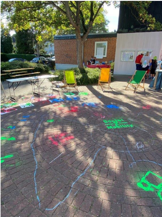
Straßenmalaktion mit Kindern zur Europäischen Mobilitätswoche im September 2020