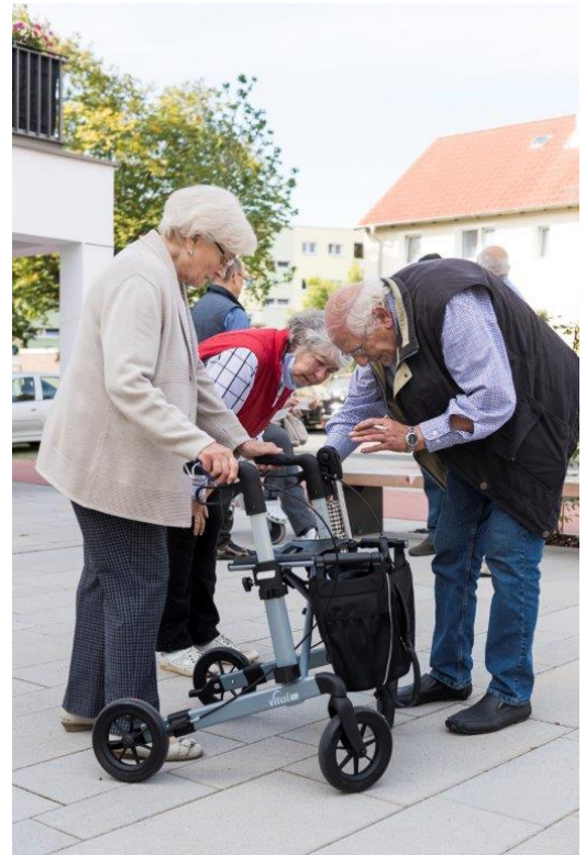
Rollatorparcour zur Europäischen Mobilitätswoche im September 2020