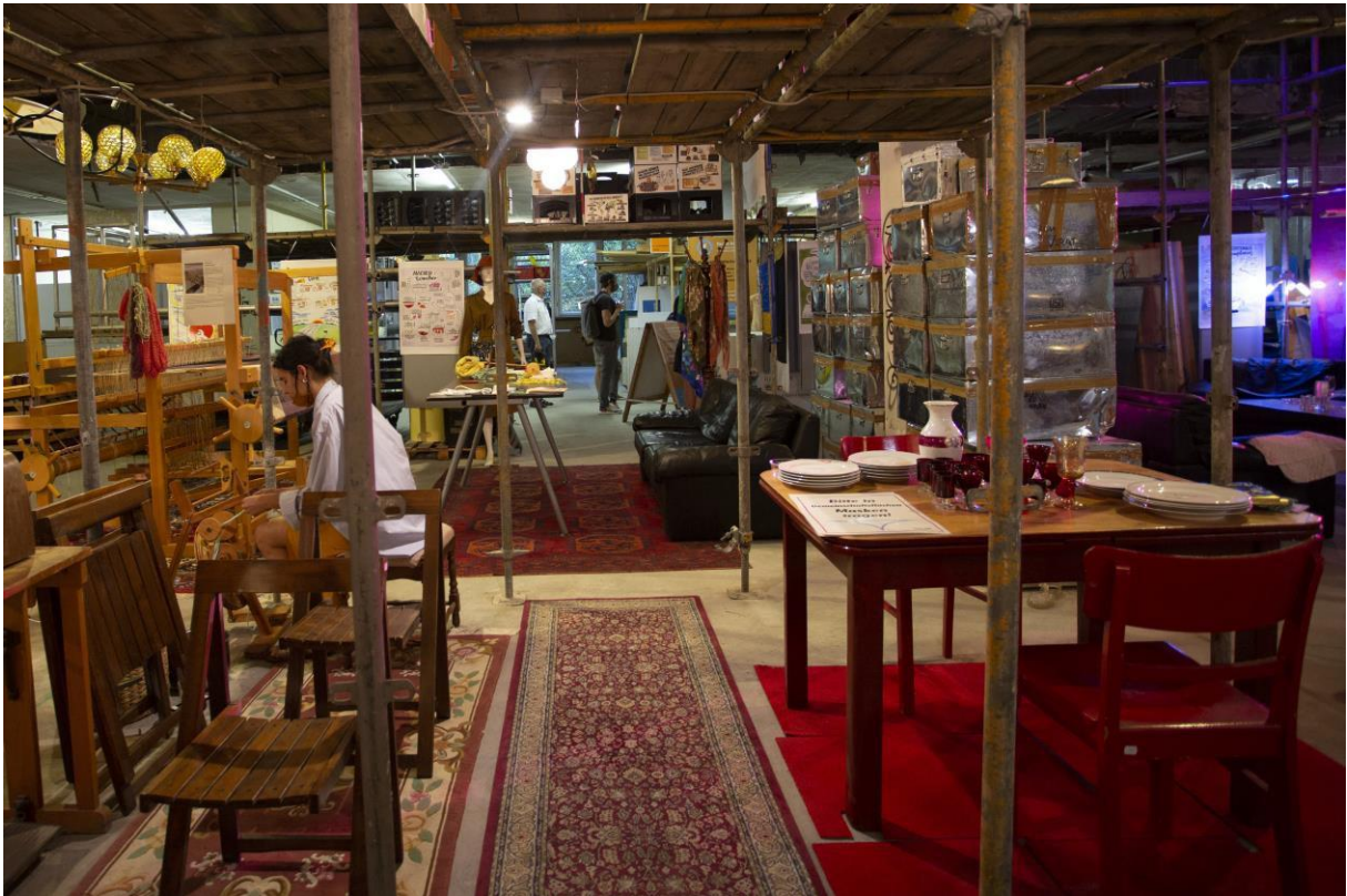
Abbildung 4: Berliner Stadtmission