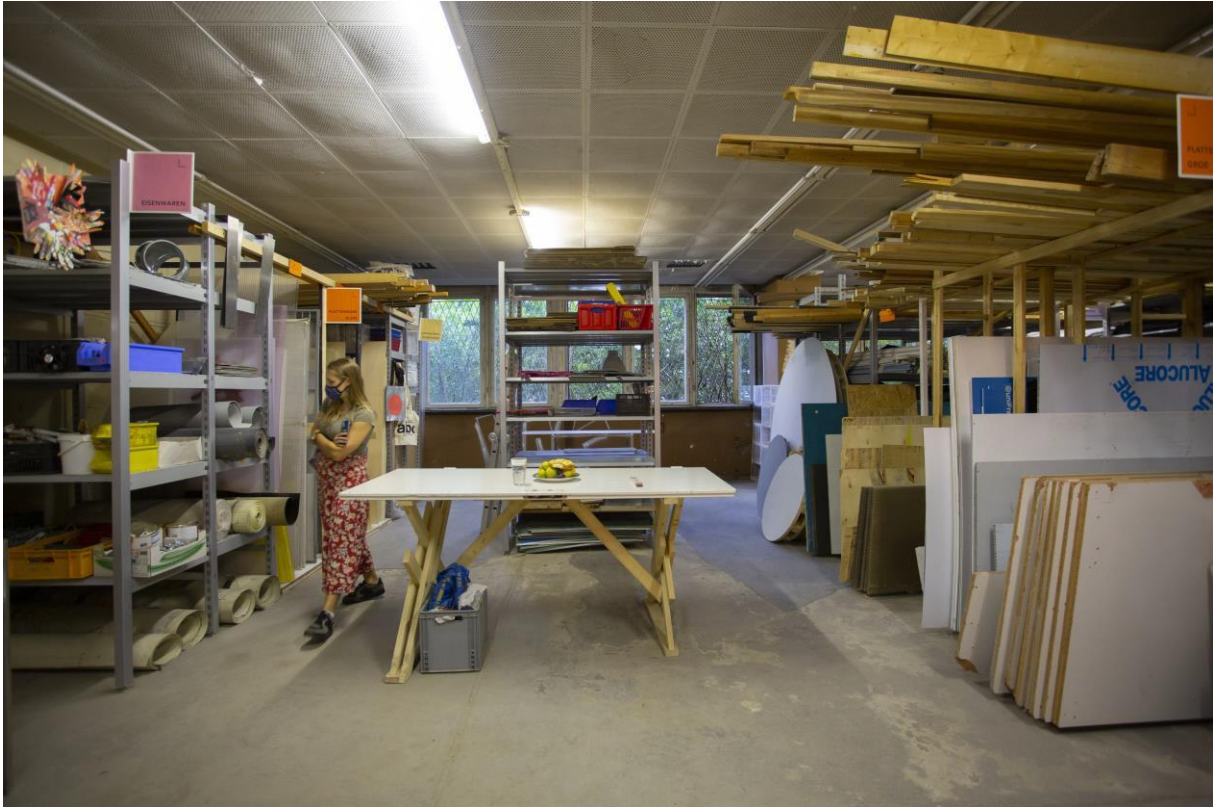
Abbildung 3: Kunst-Stoffe e.V. (16.09.2020)