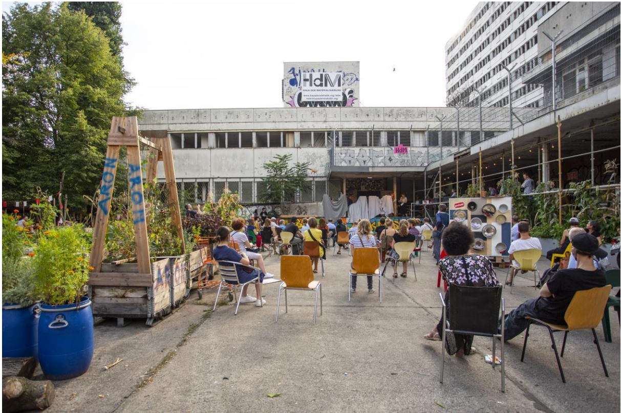
Abbildung 1: Eröffnung des Haus der Materialisierung (16.09.2020)