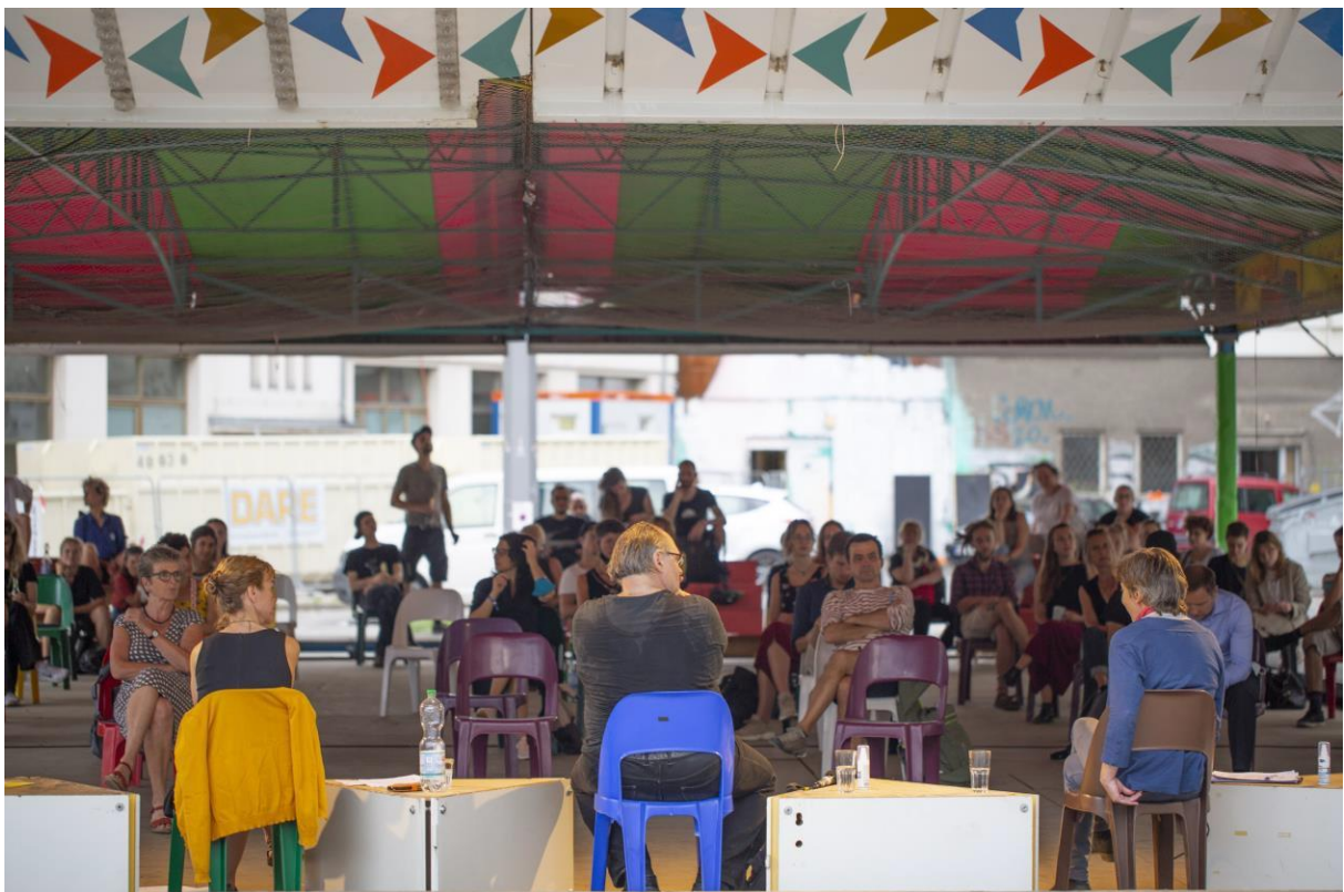
Abbildung 2: Panel globale Stoffströme (16.09.2020)